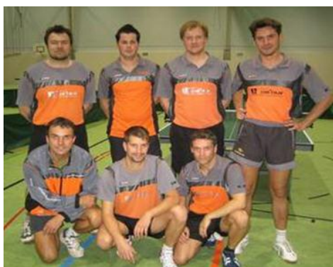
1. Herrenmannschaft 09/10

Die erste Herrenmannschaft wurde 6 von 11 Mannschaften in der II Bezirksliga Inn. Die zweite Herrenmannschaft wurde 3 von 10 Mannschaften in der I. Kreisliga. Die dritte Herrenmannschaft wurde 3 von 10 Mannschaften in der III. Kreisliga Nord. Die vierte Herrenmannschaft wurde 5 von 11 Mannschaften in der IV. Kreisliga Nord. Die fünfte Herrenmannschaft wurde 8 von 11 Mannschaften in der IV. Kreisliga Süd.