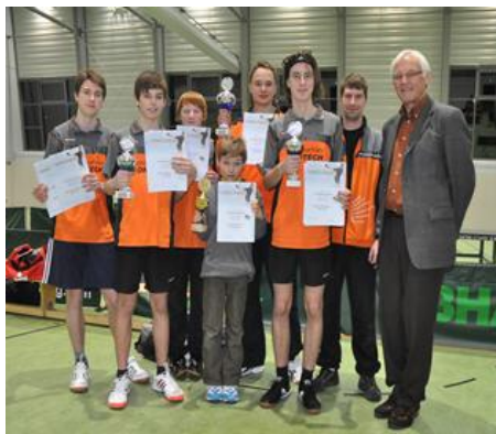
Teilnehmer der Jugendvereinsmeisterschaft